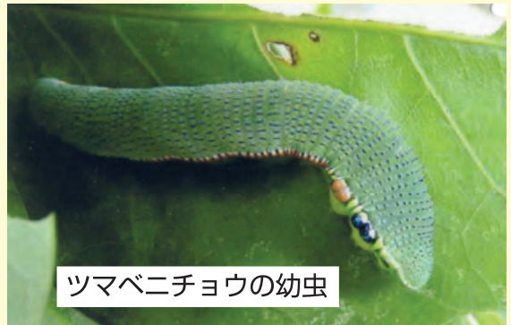
ツマベニチョウの幼虫

生き物の色には、きちんとした理由があるんだ。例えばチョウの幼虫は、葉っぱの色と同じような緑色なんだよ。これは、「保護色」と言われていて、外敵から身をかきすために長い年月をかけて身につけたオドロキの方法なんだ。