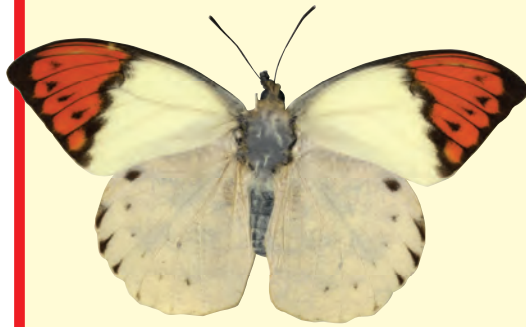
ツマベニチョウの成虫

ツマベニチョウの幼虫のおなかにあるオレンジ色は、葉っぱの上ではとても目立つ色だよ。これは、外敵から身をかきす保護色とは正反対で、近づいてくる外敵をおどろかすための警戒色と言われているんだよ。