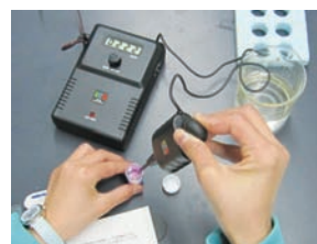
機械で測定しているところ

この講座では、事前に貸し出すカプセルで二酸化窒素を採集し、測定機で濃度を測定します。二酸化窒素は、呼吸器に悪影響を及ぼす大気汚染物質の一つです。なので、二酸化窒素をできるだけ出さないようにするにはどうしたらよいか、できることを考えます。