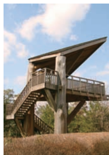
展望台「風のとりで」は園内を眺望できます。