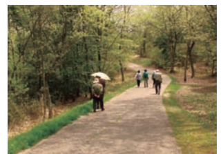
全長約8キロの散策路があり、森林浴をしながら、気持ちよくウォーキングできます。