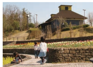
ビジターコテージ「森のまなびや」。森林公園の利用案内、行事イベントなどの情報提供を行っています。