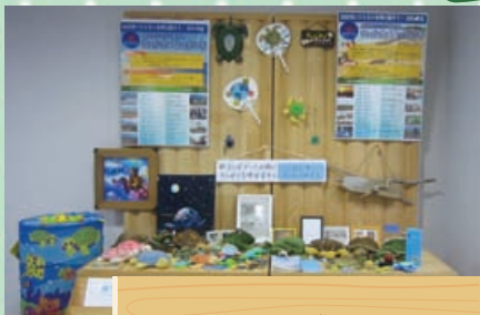
12月 四日市ウミガメ保存会

アカウミガメの産卵が7年ぶりに確認された、2010年7月四日市市楠町の吉崎海岸。大きく新聞に掲載されたことは、まだ記憶に新しいところです。 2011年は残念ながらアカウミガメの姿をみることはできませんでしたが、2009年から続けている海岸清掃は、毎月第1日曜の朝8時から雨の日でも続けられています。 今年の夏には、もう一度、子ガメちゃんたちに会えたらうれしいですね。