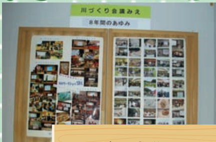
1月 川づくり会議みえ

アカウミガメの産卵が7年ぶりに確認された、2010年7月四日市市楠町の吉崎海岸。大きく新聞に掲載されたことは、まだ記憶に新しいところです。 2011年は残念ながらアカウミガメの姿をみることはできませんでしたが、2009年から続けている海岸清掃は、毎月第1日曜の朝8時から雨の日でも続けられています。 今年の夏には、もう一度、子ガメちゃんたちに会えたらうれしいですね。