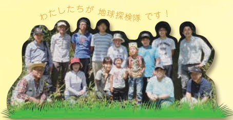
わたしたちが地球探検隊です！