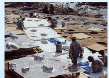
レプリカ制作。型の取り外し作業。

長さ60センチの巨大なミエゾウの足跡化石！MieMuの全身骨格の大きさは、この足跡をもとに作られました。