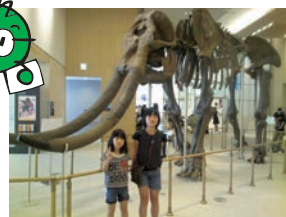
三重県総合博物館に行きました