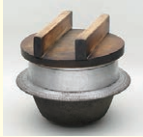
羽釜(三重県総合博物館蔵)