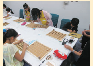
みんな真剣なまなざしで作業中!