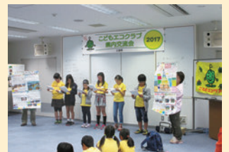
四日市尾平イオンチアーズクラブ発表

体験学習では、どんぐりの種類や見分け方のお話を聞いた後に、どんぐりカレンダーづくりを行いました。細かい作業が続きましたが、みんな上手にカレンダーを完成させることができました。