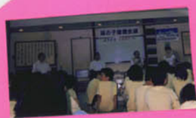
琵琶湖環境会議 環境大臣と知事らに会う