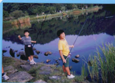
そね沼での魚釣り

・琵琶湖につながるこの沼で短い間(時間位)2人で10cm位のを6匹釣った。この沼には他には何もいそうになかった。大きなブラックバス(1mくらい)がうようよいた。