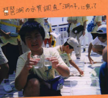
琵琶湖の水質調査「湖の子」に乗って