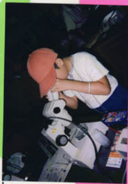
プランクトン観察

三重県では、 しが県 では琵琶湖ルールというものがあって魚のリリースを禁止しています。三重県ではそのようなルールがありません。こうしている間に自然の生態系が壊れていくかもしれません。外来魚のリリースを県でとりあげてほしいです。