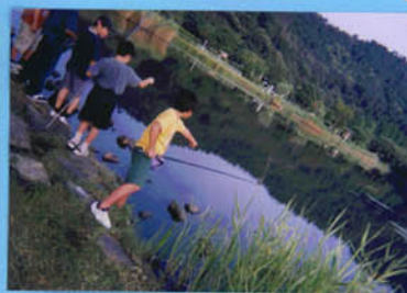
ブラックバス発見

ブルーギルやブラックバスが昔からいた魚(フナ、モロコビワマスなど)を食べてしまう。