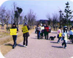
ワンちゃんも いっしょにパレードです。

犬フン放置やゴミのポイ捨てのないキレイな道にしたいパレードをしました。大きな声で呼びかけました。