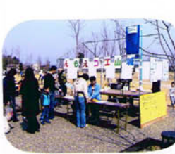
正解には エンペツが消ゴムをあげました。

北勢地区最大の環境ビッグイベントに参加しました。お客さんも大ぜい来てくれました。