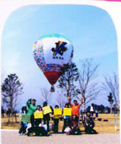
カッパさんも いっしょにポーズ!! アドベンチャーに乗りかかった。

北勢地区最大の環境ビッグイベントに参加しました。お客さんも大ぜい来てくれました。