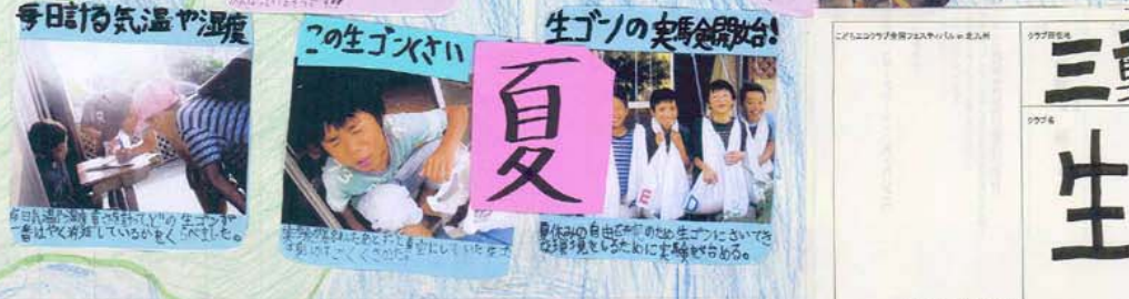
夏 生ゴンの実験開始! 生ゴングラブの活動を夏に行きました。いろいろな場所で行っています。