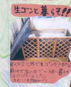
生ゴンと暮らす!! 生ゴンについて取材