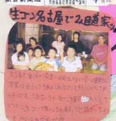
冬 生ゴン名古屋で2日連続 名古屋で3日目生ゴン名古屋