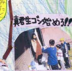
真君生ゴン始める!! 生ゴンの産みの親夫婦先生