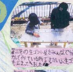
春 生ゴン名古屋をみんなはでかして作っている所です。生ゴンもまかせておきましょう。