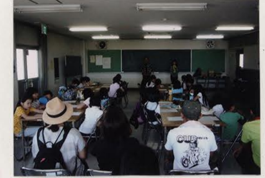
うみくらの先生方のお話を聞いているところ。