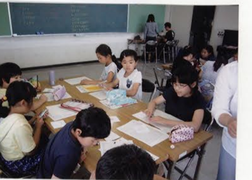
川から帰ってきた着替えの後。