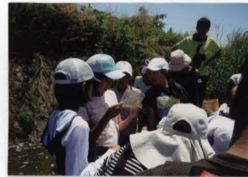
とった水生生物を観察しているところ。