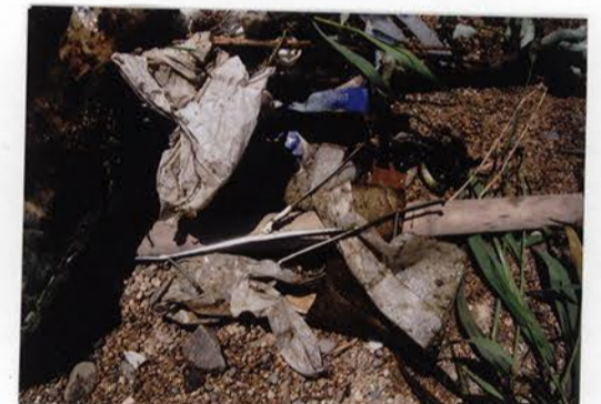
水生生物を観察した後、川に捨てたゴミ。