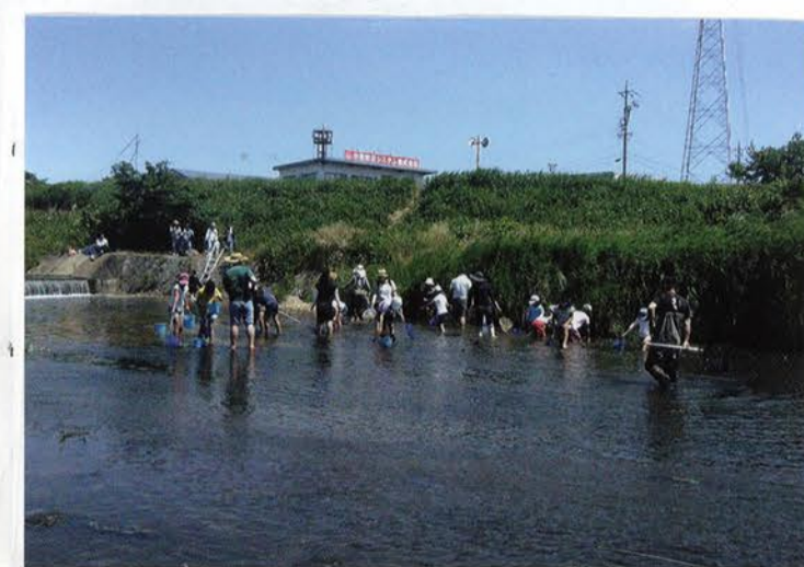
かんざつしている様子