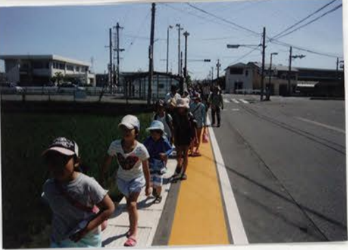
海蔵川に向かって、出発!