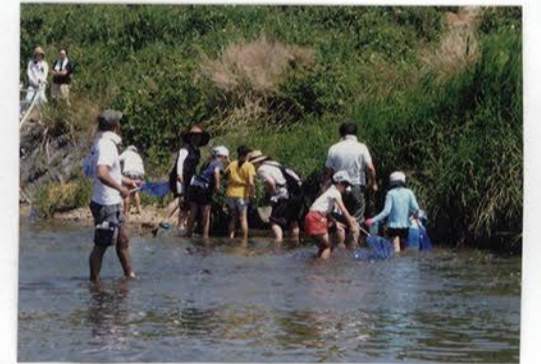
水生生物を探そう!!