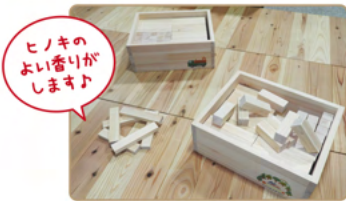
ヒノキのよい香りがしますよ

7月28日「ECOサマーデイ」では、「つみき」であそぼうのコーナーで子どもたちが想像力を膨らませて遊んでいました。