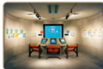
▲観測データ速報室