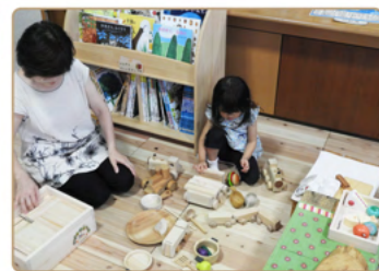
▲木のおもちゃコーナー