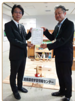
三重県環境生活部環境共生局長の感謝状をお渡ししました