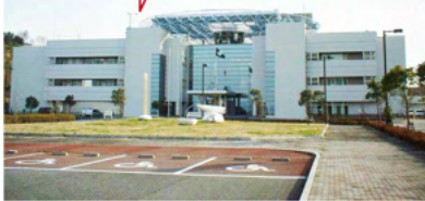
かつては屋上に風力発電の小型風車がありました

今後も環境学習の推進を図るため、環境学習プログラムやホームページ等の充実、多様な講座の開催に努めてまいります。