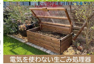
電気を使わない生ごみ処理器

予告 4月16日(水)~5月6日(火・休) 特別展「令和6年度三重県地球温暖化防止啓発ポスターコンクール入賞作品展」 三重県環境学習情報センター